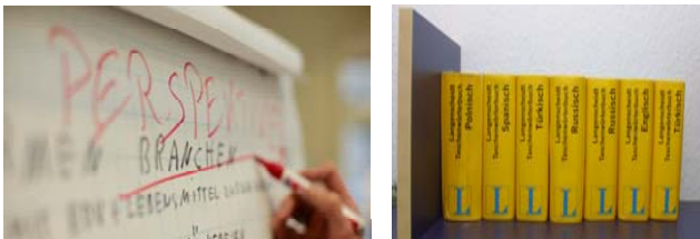
JSL-Sprachkurse Deutsch sprechen, Deutsch lesen, Deutsch schreiben.

Nehmen Sie unsere Leistungen in Anspruch.