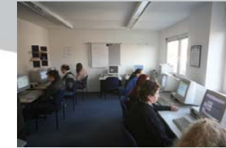
Lernen durch Sprechen in modernen Schulungsräumen.